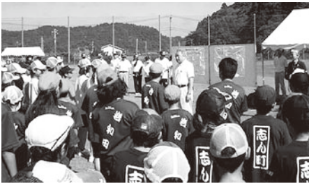
▲100名以上の参加があった青少年つどい大会