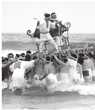
▲今年の八坂神社祭典の様子海の神を祭る男たち