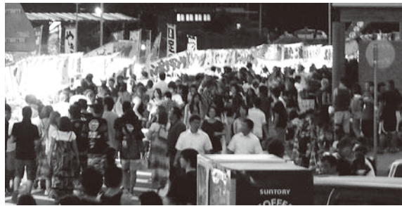
▲花火が始まる前から賑わいを見せる屋台通り

海岸や屋台の周りには、約10,000人が来訪し、スターマインや水中花火など、おんじゆくの花火に思い思いの歓声を上げていました。