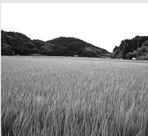
▲流通が待ち遠しい新米

米づくりは土と水が密 接に関わっています。お いしくお米を食べるには、 お米を作った水と同じ水 でお米を炊くのが一番お いしいと言われています。 御宿の土地で元気いっぱ いに育ったお米を、御宿 の自然の恵みを感じなが ら口にしてみたいいかが でしょうか。