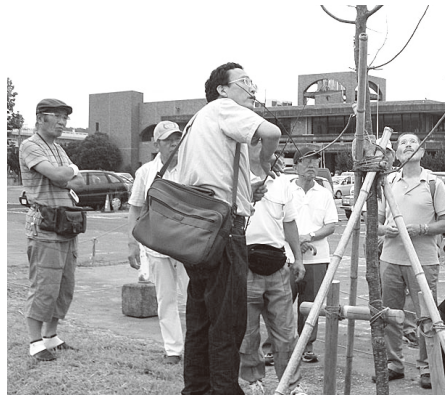
▲植栽した桜の状態を確認するさくらワーキンググループ

初めからボランティア活動を行う事は難しいかもしれません。しかし、地域のコミュニティやサークル等に参加し、その繋がりからボランティア活動に発展する事があるのではないのでしょうか。まずは地域コミュニティやサークル活動へ参加してみませんか。