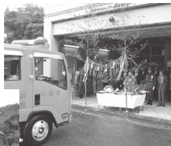
▲今後、火災や災害現場での活躍が期待されます

第七分団（岩和田）可搬積載型消防ポンプ自動車納車式が3月17日に行われました。町消防団に配備された消防ポンプ車の老朽化に対応するため配備されたもので、21年ぶりの更新となります。