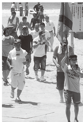
▲津波避難訓練の様子

●平成7年に発生した阪神淡路大震災を教訓に平成12年度に町域防災計画が見直しされてから12年が経過しました。昨年3月に発生した東日本大震災や、近年たびたび発生する自然災害を教訓に、千葉県地域防災計画を参考に町防災の根幹である町域防災計画を見直します。