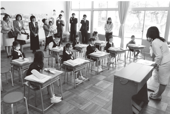
▲ドキドキわくわくの初授業

また、4月9日には町内の二つの小学校で入学式が行われ、御宿小では27名の新入生が入学し、在校生の愛情あふれる出迎えに、元気いっぱい姿で応えていました。