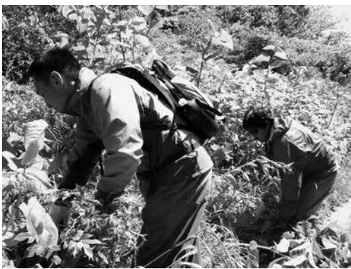
▲地元ボランティアによるコース整備

☎0470・68・6320 HP http://onjuku-de-genki.org/