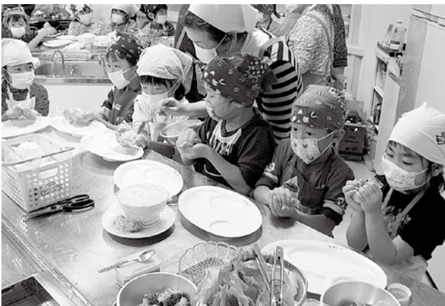
▲食生活改善会による保育所食育講習会

また、親と子の料理教室の開催や、子どもたちを対象とした紙芝居を使った食育講習会、調理実習を行い、幼いうちから食に関心を持つてもらうとともに、鶴亀くらぶ、老人クラブを対象とした試食品の提供や、調理実習を開くなど、年齢に応じて必要な栄養をバランスよく摂取してもらうための啓発活動を行っています。