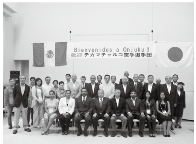
▲空手使節団歓迎会