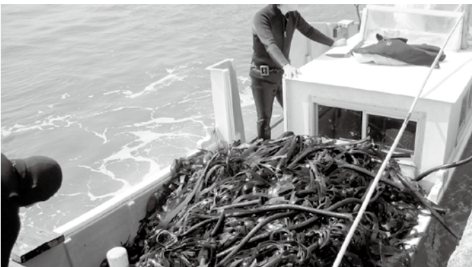
▲カジメ等、海藻の古木刈り

豊富な漁場であるためには、エサ、住みか、水温等、海洋生物が生息しやすい環境が必要となってきました。 アワビやサザエのエサとなるカジメ、アラメ等の藻類。これら藻類の生育環境を整えるため、漁業協同組合では海藻の古木の伐採を行っています。固く、背