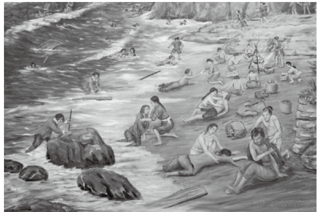
▲救助している村民の想像絵（歴史民族資料館蔵）

今後10月下旬にテカマチャルコ市との姉妹都市協定の調印のため町長を団長とする友好親善使節団をメキシコ合衆国へ派遣します。