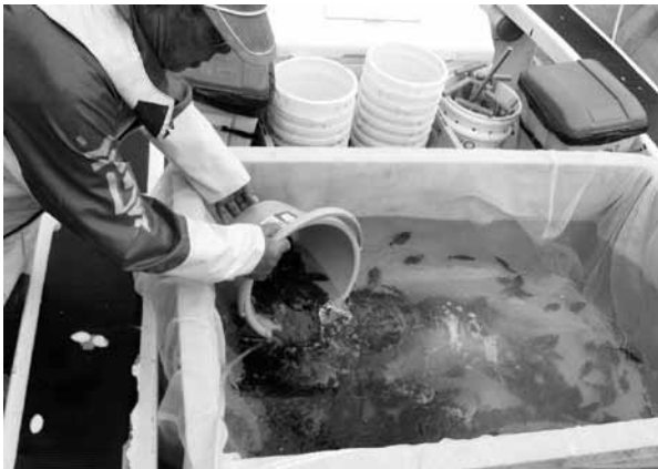
▶放流されたヒラメの稚魚

て、設置場所や漁礁となるブロックの形状等についての調査・研究をし、その結果を用いて計画を策定していきます。 ◆獲る漁業から育てる漁業へ 水産資源は生物資源であり、再生産するという特性があります。この特性を生かせば水産資源の豊かな状態を持続でき、水産物の安定供給ができるはずですが、しかし、漁業の技術の進歩により、大量の魚を一度に獲ることができるようになったこと