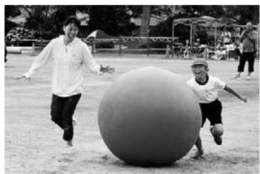
▲親子競技の「大玉ごろんごろん」