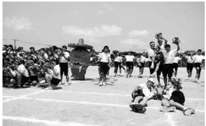
▲全校ダンスにエビアミーゴが登場

赤団、白団の力が拮抗する中、生徒たちはお互いに最後まで力を出し切り、わずか4点差で白団が接戦を制しました。