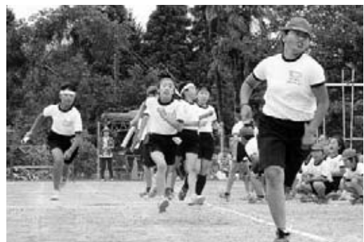
▲全校児童によるリレー