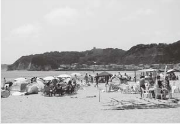
▲安心・安全な海水浴場を目指します

町では、皆さんに安心して海水浴場を利用していただけるよう、ルールを設けています。ゴミ・たばこのポイ捨てや22時以降の花火、海水浴場内での水上オートバイ等の走行の禁止などを定めており、夏期には啓発チラシを配布して、安心・安全な海水浴場の利用を呼びかけます。