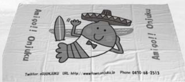
▲今年も入園スタンプを集めるとエビアミーゴどでかタオルがもらえます

通常のじゃんけん大会は定期的に開催されますが、エビアミーゴが登場するのは7月23日（土）と8月11日（木）の2回の予定です。