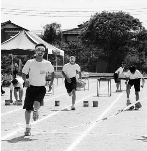
▲舞妓さんのおしろいを付けて「そうだ！京都へ行こう」