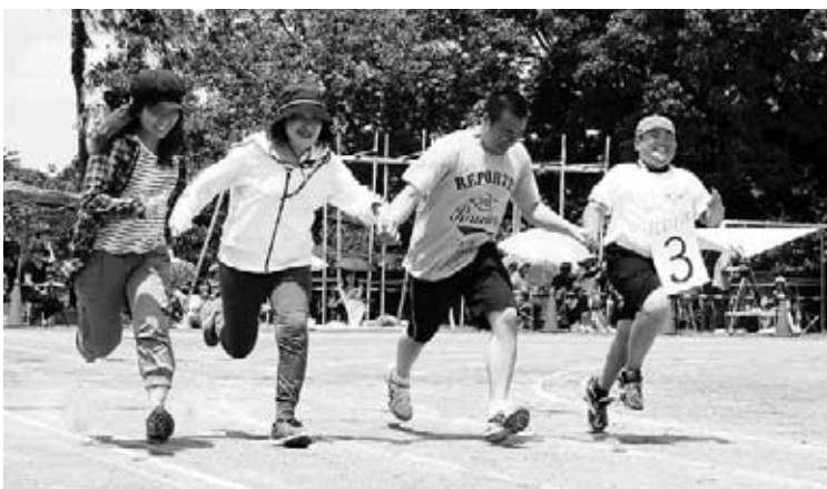
▲地域の方の助けを借りてゴール

児童がそれぞれカードに書かれた人数の保護者・地域の方と手をつないで走る競技「Help me」では、参加者全員がゴールまで笑顔で走り切りました。