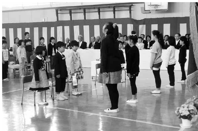
▶布施小学校 上級生から歓迎の言葉を受ける様子

新入生の呼名では、各学校の新入生一人ひとりが大きな声で立派に返事をし、在校生や先生方、地域の方のあたたかい歓迎を受けて新生活をスタートさせました。