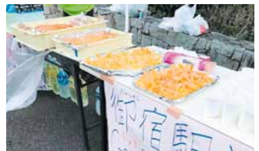
▲御宿産のオレンジピール

400年前に前フィリピン諸島長官ドン・ロドリゴ率いるサンフランシスコ号が岩和田海岸沖で座礁したとき、岩和田の村民たちにより317名が救助され、手厚く保護された歴史も御宿のおもてなしを物語っています。そのよゆうな御宿の魅力を伝えようと南房総ウルトラマラソンのエイド運営に携わりました。