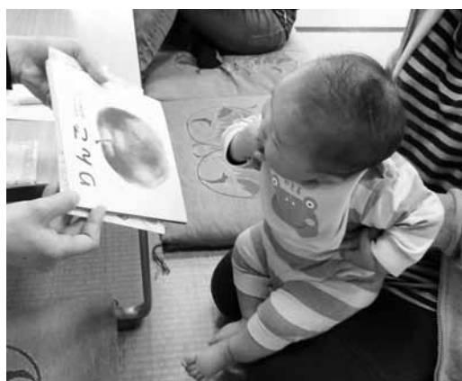
▲絵本に興味津々の様子

初めて絵本に触れた子は紙の感触が面白いようで、積極的に絵本を掴んだりページをめくったりしていました。