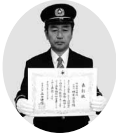
本部長 神定 浩壽 千葉県知事 永年勤続功労章