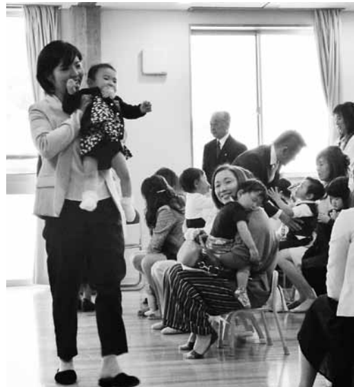
▲おんじゅく認定こども園 元気な子どもたちが入園

いつもと違う環境に少し戸惑っている様子の入園児もいましたが、元気に動き回ったり、初めて会った同年代の友達と遊んだり、活発な姿が見られました。