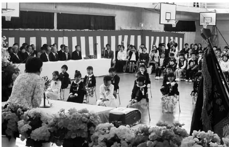
◀御宿小学校 校長先生の話聞く新入生