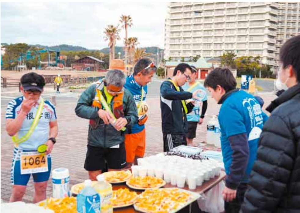
▲月の沙漠記念館前でエイド（給水や給食を行う施設）を担当。約250人の方々に立ち寄っていただきました。