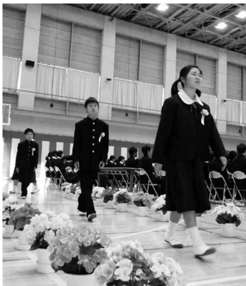
▲御宿中学校 引き締まった表情の新1年生たち

御宿中学校で4月6日（金）に、御宿小学校と布施小学校で9日（月）にそれぞれ入学式が行われました。