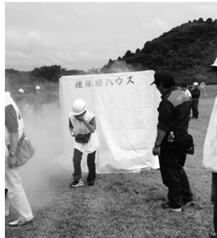
▲煙の中を移動する際は口をおさえましょう

第2部では御宿台多目的広場において、消防団フェスタが開催され、火災時の煙体験、消防団の資機材展示、小型ポンプを利用した放水体験、夷隅広域消防による応急救護訓練・初期消火訓練など様々な訓練コーナーが設置されました。