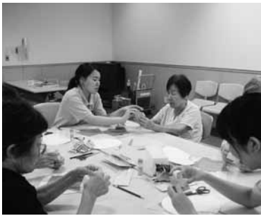
▲折り紙で指先の体操

高齢者の方は特に学生との交流を楽しみにしており、一緒に体操などをする時は、とてもいきいきと活