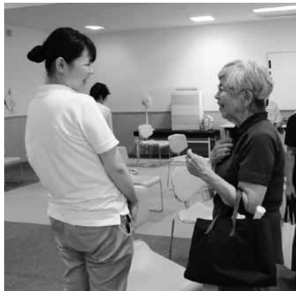
▲地域の方から様々なことを学びます

動しています。また、実習の中で高血圧予防に関する講義を実施した際には、参加者から「今後もこのような講義を聴きたい」という意見が出ました。