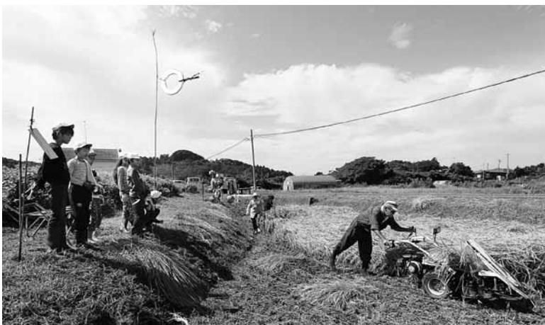
▲手刈り以外にも農機具を使った稲刈りを勉強

また、刈り取りと束ねる作業が同時にできるバインダーと呼ばれる農機具や、コンバインなどの説明を聞き、稲刈りについての知識を深めました。