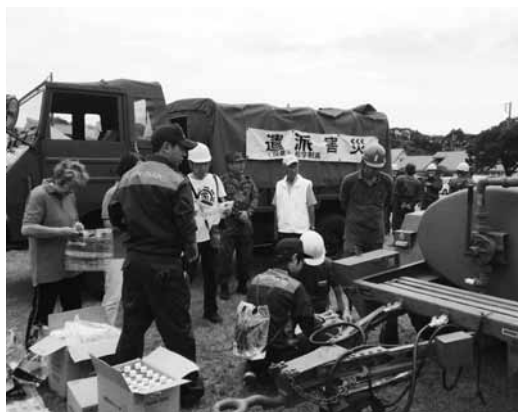
▲自衛隊の資機材を見学

また、陸上自衛隊、勝浦海上保安署、いすみ警察署、東京電力パワーグリッド(株)、東日本電信電話(株)など関係機関の協力により、自衛隊資機材を活用した給水訓練や災害時のブレーカーの取り扱い、住宅用火災警報器の展示、災害用伝言ダイヤル体験コーナーなどが設置され、参加者は積極的に体験・見学を行いました。