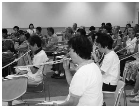
▲健康教室での口腔トレーニングの様子

戻し（縁日等で売られている「ピロピロ笛」などと呼ばれるおもちゃ）を使った口腔のトレーニングを行いました。