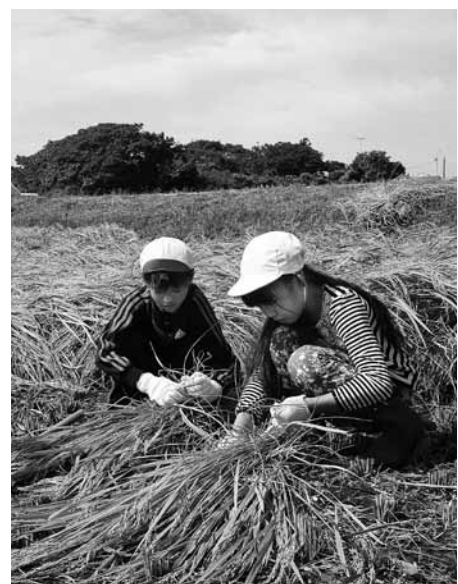
▲稲を1本も残さないようにしっかりと束ねます