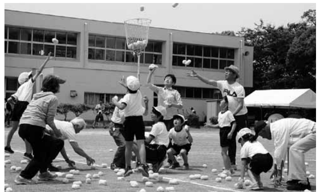
▲「なかよし玉入れ」たくさん入ったかな？