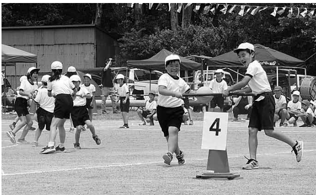
▲協力してボールを上手く運べたね