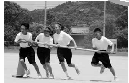
▲「網白湾台風 令和1号」御宿中学校に台風がやってきた！

恒例の色別対抗リレーでは、会場から大きな声援が沸き上がり、友情やチームワークを感じられる運動会でした。