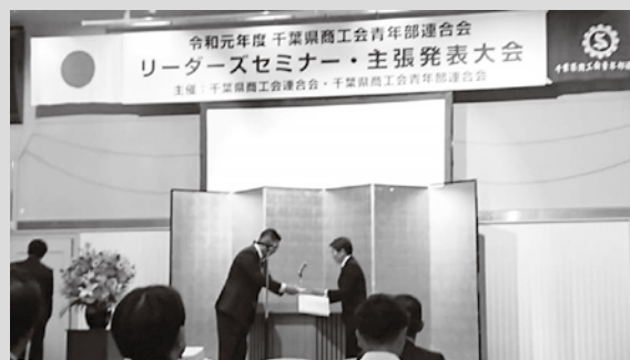
▲主張発表大会にて表彰される様子