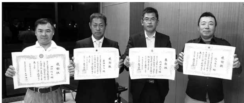
表彰状・感謝状の贈呈式に出席した方々

長年にわたり、子供たちの健全な育成や地域の見守り活動にご尽力いただいた青少年相談員の退任に併い、千葉県知事及び環境生活部長から表彰状・感謝状が贈呈されました。