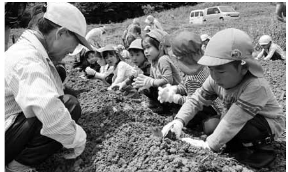
さつまいもの苗植えに挑戦する児童▶

秋にはさつまいも掘りを行い、収穫したさつまいもで焼きいも大会を実施するそうです。