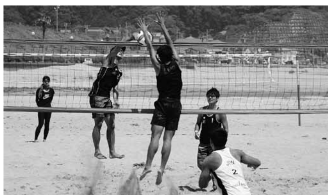
▲コートごとに熱い戦いが行われました

日差しが厳しいなか、国体予選と一般参加のジャパン予選が男女別に行われ、白熱した試合が繰り広げられました。