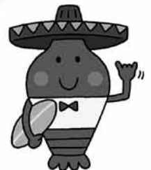
御宿町イメージキャラクター「エビアミーゴ」