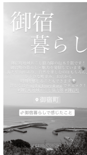
▲Instagramでも紹介 していただきました