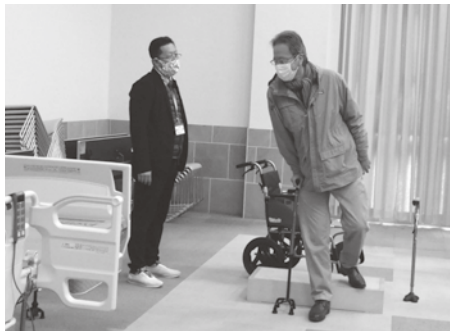
▲杖での段差の上り下りを実践

多くの方々が介護の分野で働くことや介護に関する不安を払拭し、障壁なく介護分野に参入できることを目的とした「介護に関する入門的研修」が役場大会議室で行われました。介護に関する基礎知識から認知症や障害の理解、基本的な介護方法を実践するなど、講義や実技を通して、介護への理解を深める機会となりました。