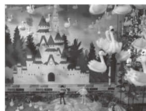
▲企画展「おんじゅくつるし雛・飾り展」の様子 開催場所：月の沙漠記念館 開催期間：4/18(月)まで

イベント中止に伴い、月の沙漠記念館では3月4日(金)から開催予定であった企画展(有料)を前倒しで開催し、つるし飾りを展示しています。また、手づくりの蔵や町内の各お店でも展示されており、色とりどりのつるし雛をお楽しみいただけます。