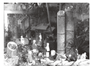
▲「手づくりの蔵」での展示の様子 開催場所：手づくりの蔵 開催期間：3/3(木)まで