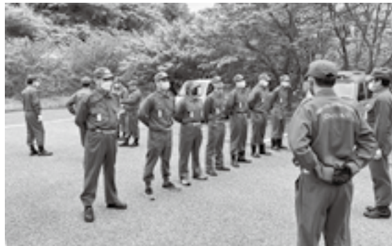
▲規律訓練を受ける新入団員