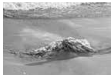
▲砂浜に埋まる大量のプラスチック

有害物質が付着したマイクロプラスチックを魚などが餌と間違えて食べてしまい、魚などの体内に入り込みます。そして、食物連鎖を繰り返して最終的に人間の体に入り込んでしまう可能性があります。