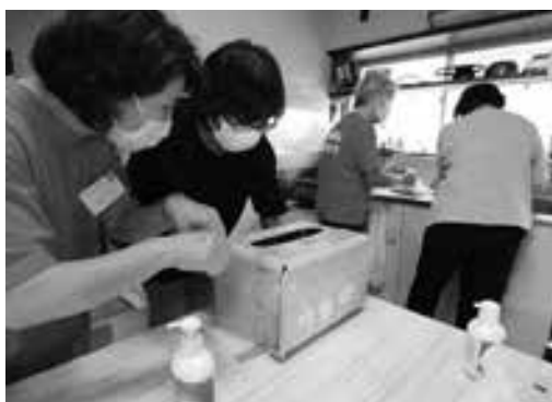
▲手洗いチェックの様子

食生活改善会（ヘルスマイト）による「食育カフェ」が交流サロンかぐやで行われました。