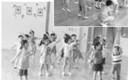
◀体操「元気イチバンバン」

質問コーナーでは、高齢者から園児に「おじいちゃん、おばあちゃんは好きですか？」と質問。園児はみんな「だいすきー！」と明るい笑顔で答えていました。高齢者の方は園児の返答に自然と笑顔がこぼれ、心温まるひと時を過ごしている様子でした。