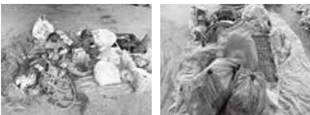
カン・ビン・ペットボトルなどのごみ