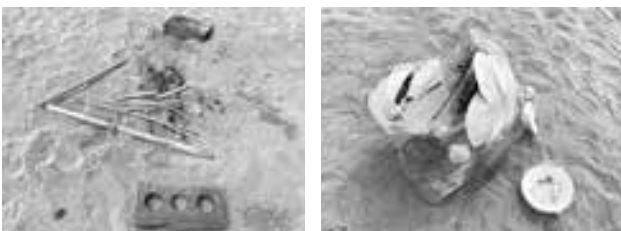
BBQ後に置き捨てられたごみ